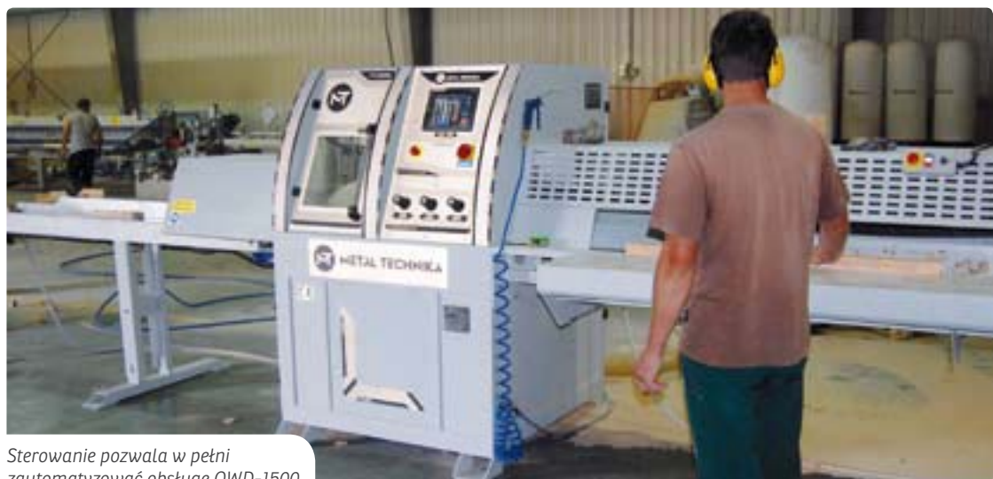
Sterowanie pozwala w pełni zautomatyzować obsługę OWD-1500.

– Polska optymalizerka zapewnia nam idealną dokładność cięcia, ponieważ producent zastosował popychanie materiału kierowanego