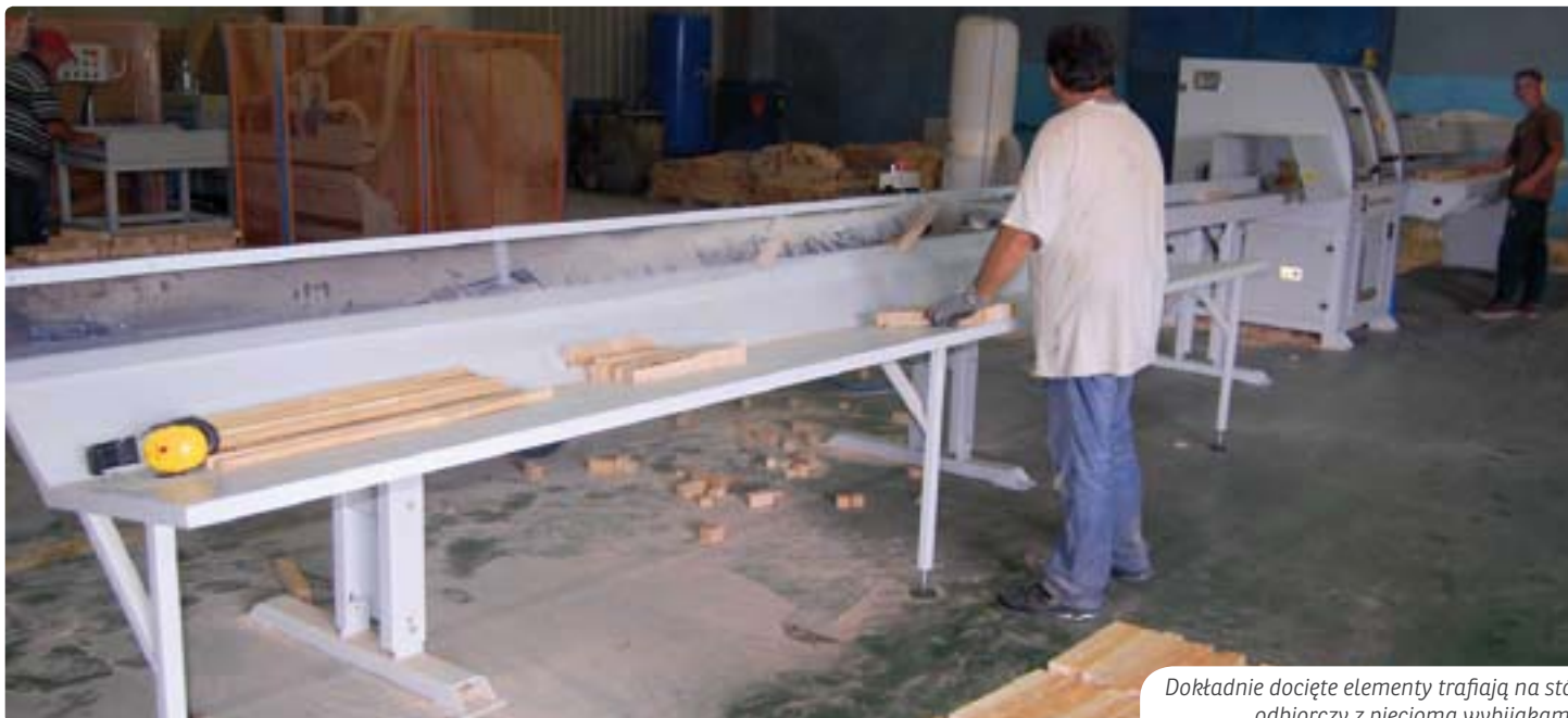
Dokładnie docięte elementy trafiają na stół odbiorczy z pięcioma wybijkami.

nia zaprogramowanych długości listew, piła wycina wady, a dokładnie docięte elementy trafiają na stół odbiorczy z pięcioma wybijkami i odbywa się automatyczna segregacja długościowa elementów.