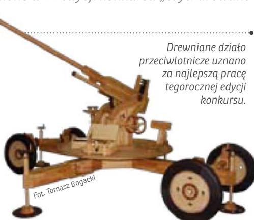
Drewniane działo przeciwlotnicze uznano za najlepszą pracę tegorocznej edycji konkursu.